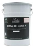
Dåse 5 l